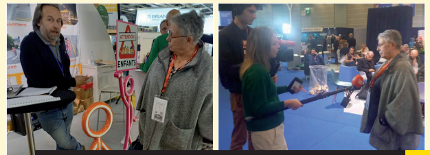
PRÉSENCE AU CONGRÈS ET SALON DES MAIRES À PARIS